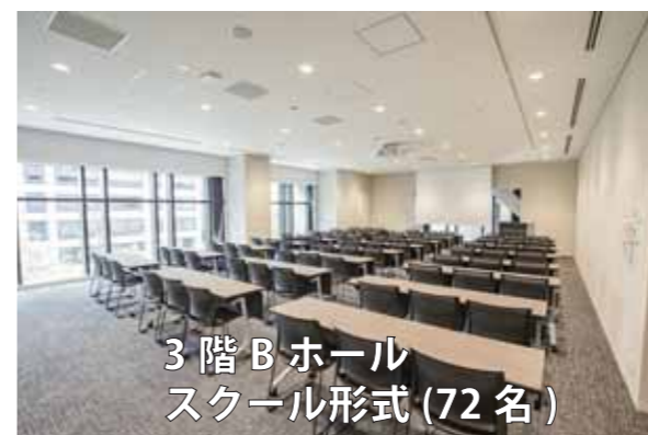
3階 Bホール スクール形式 (72名)

B・Cホールはプロジェクター・スクリーンなどを備え、展示会にも対応できます。 D・Eホールは少人数の会議・打ち合わせ、他ホールの控え室として利用可能です。