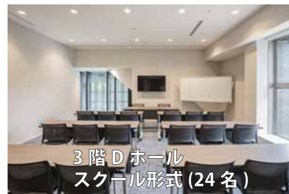
3階 Dホール スクール形式 (24名)