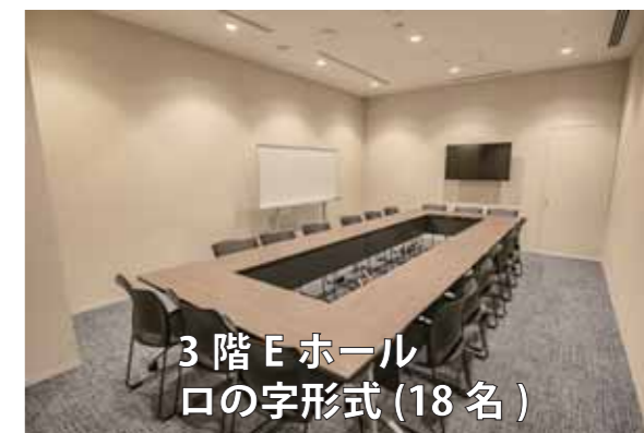
3階 Eホール 口の字形式 (18名)