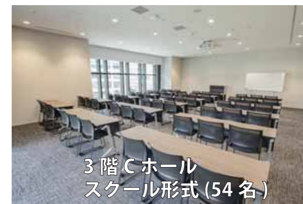
3階 Cホール スクール形式 (54名)